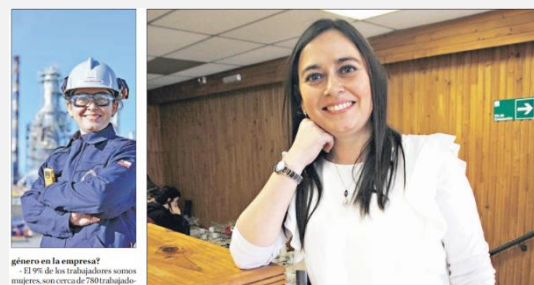
género en la empresa? - El 9% de los trabajadores somos mujeres, son cerca de 780 trabajado-